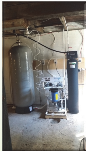
Avec prétraitement FSL