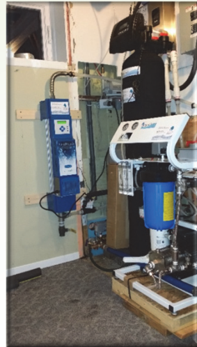
Avec UV UpStream